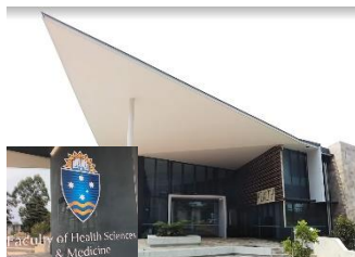
ボンド大学 Faculty of health science and medicine