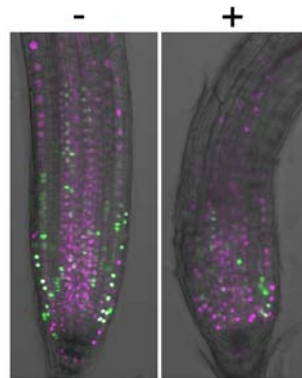
図 3. 細胞周期を可視化させたシロイヌナズナの根

細胞分裂では、細胞が実際に分裂する時期（M 期、M = 「分裂」を意味する Mitosis の頭文字）の他に、DNA を複製して分裂に備える時期（S 期、S = 「合成」を意味する Synthesis の頭文字）と、それぞれの間中期（G1・G2 期、G = 「間」を意味する Gap の頭文字）があります。これらの時期（細胞周期）が繰り返されることで、細胞は分裂を続けます。chem7 がどの時期を阻害するのかを調べるために、2 色の蛍光タンパク質を使って細胞周期の進行を可視化させたシロイヌナズナを用いました。このシロイヌナズナの根では、さまざまな時期の細胞が混在しているため、どちらの色の細胞も観察されます（図 3）。この根に chem7 を投与したところ、両色が混在したまま、光る細胞が存在する領域（細胞分裂活性の高い組織）が小さくなりました（図 3）。このことから、この化合物は、特定の細胞周期を標的とするわけではなく、どの時期の細胞に対しても阻害効果を発揮できると考えられます。つまり、chem7 は細胞周期の時期にかかわらず、急速に細胞の活性を停止させることで、細胞や組織の形をゆがめることなく、成長を止めることができるのではないかと推察されます。さらに、chem7 を添加して細胞分裂を阻害した根や培養細胞からこの化合物を洗い流すと、再び細胞分裂を始めることができました。このことから、この薬剤は細胞分裂を停止させている間でも、復旧できないほどの重篤な異常は引き起こさないことが分かりました。